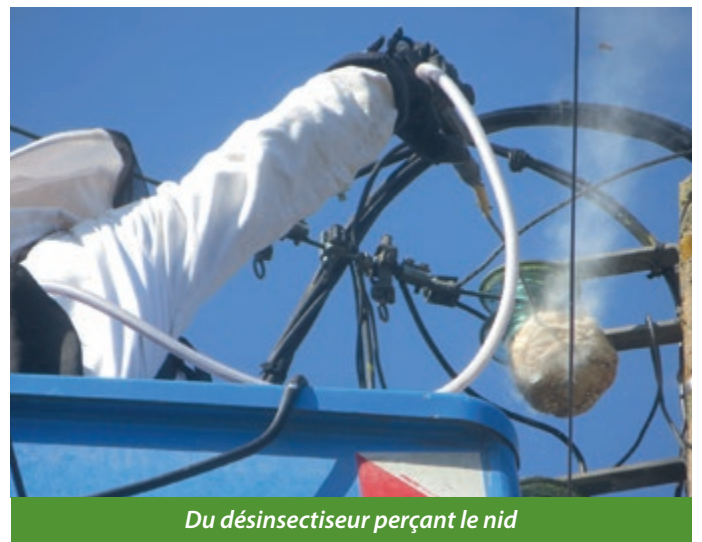
Du désinsectiseur perçant le nid

La photo représente un nid de frelons asiatiques fixé tout en haut d'un poteau électrique... Il a fallu l'intervention d'un professionnel pour déloger les dangereux locataires qui empêchaient les techniciens d'ENEDIS d'intervenir sur le transformateur, alors qu'un fil nu était tombé au sol déclenchant un début d'incendie de broussailles... Quand ça veut pas, ça veut pas !