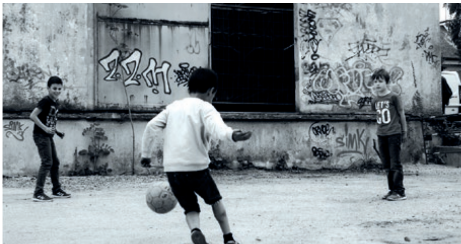
▼ Jam Session