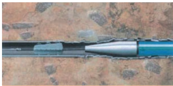
Réhabilitation par éclatement

Les services de la Préfecture (DDTM) imposent à la compagnie fermière SAUR de signaler tous les déversements des eaux usées dans le milieu naturel après chaque épisode pluvieux. Au vu des résultats, peu enclins à la sauvegarde de la potabilité des eaux du Frémur, la Municipalité a décidé au printemps 2017 de faire vérifier par le cabinet ATEC Ouest l'état des canalisations qui alimentent, le poste de relevage des eaux usées de Lauriais. Un poste qui reçoit les effluents de la Rouxière, de la Butte de Broons, de Lauriais, de la Ménardièrre et de son nouveau lotissement. Le rapport d'inspection télévisée démontre sans ambages et plus