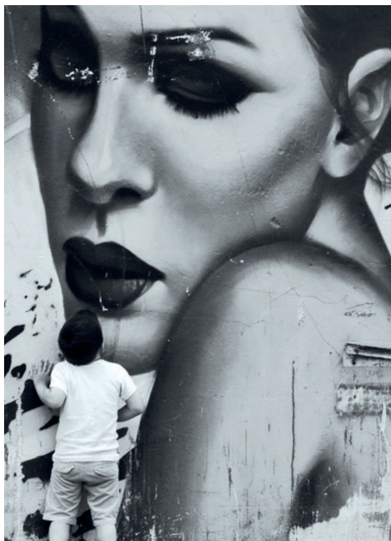
▼ Chansons à boire