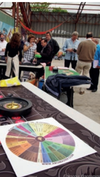
▲ Casino du Vin Laura Lepers