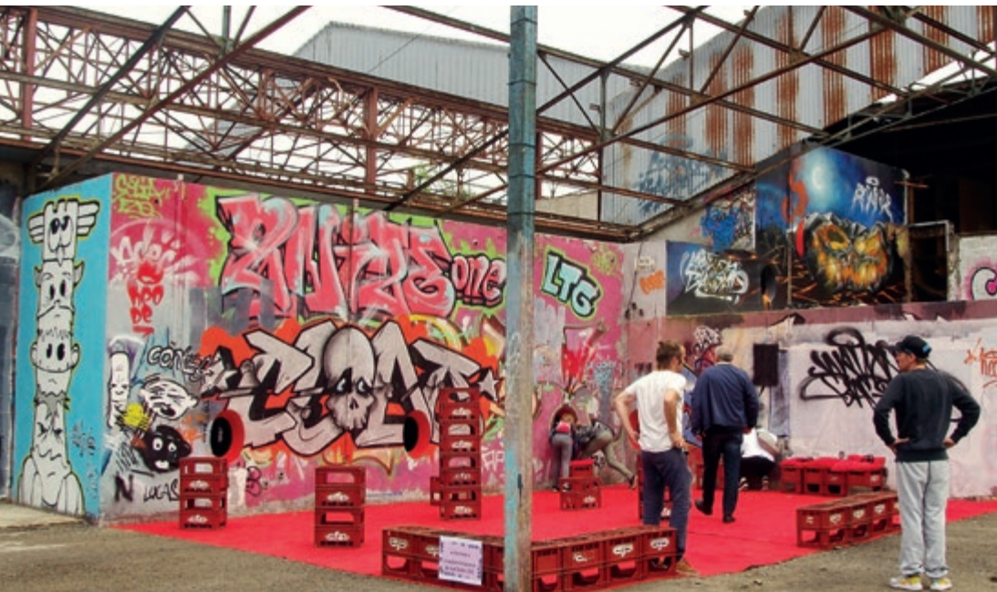
▲ Installations sonores «Les Cuves» de Guillaume Obé