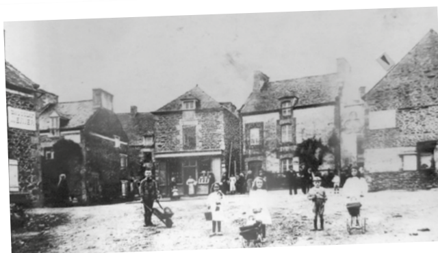
En 1939, bâtiment de ferme abattu pour agrandir la place de Trigavou (carte postale de 1919)