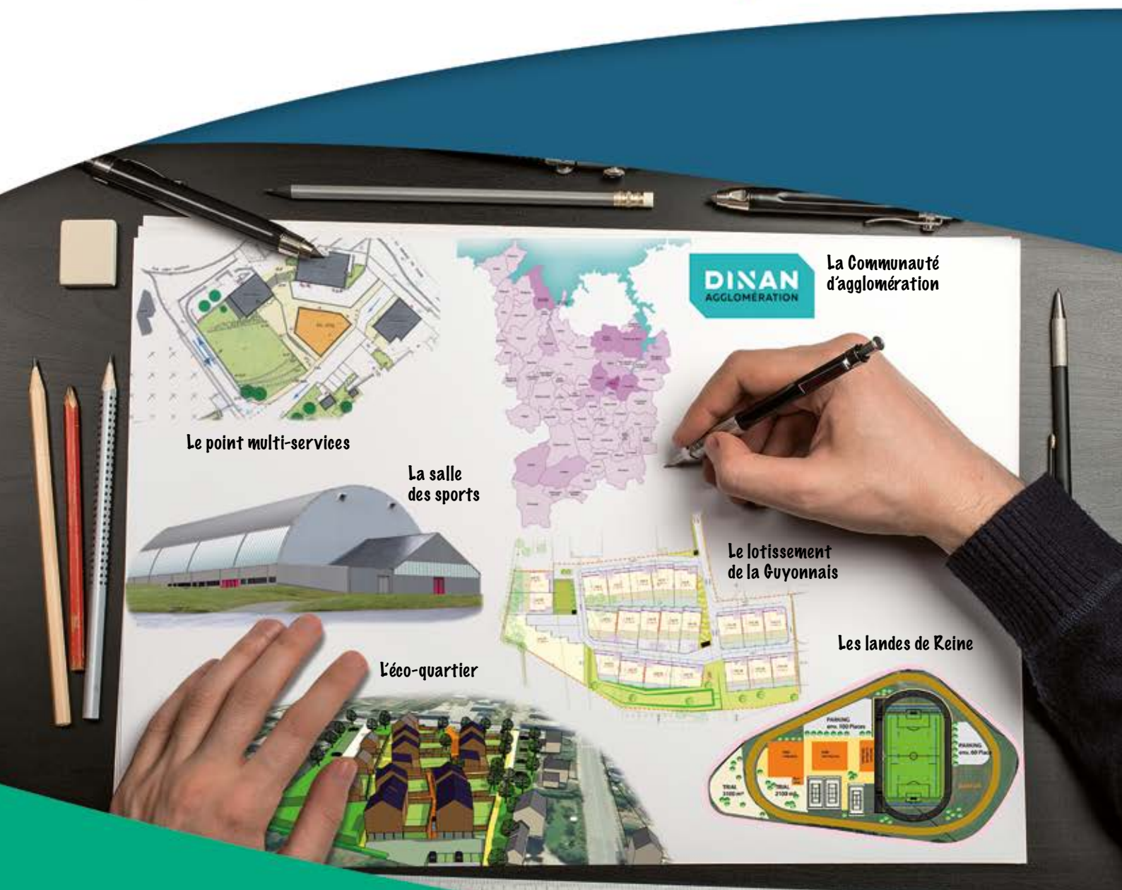
Le point multi-services