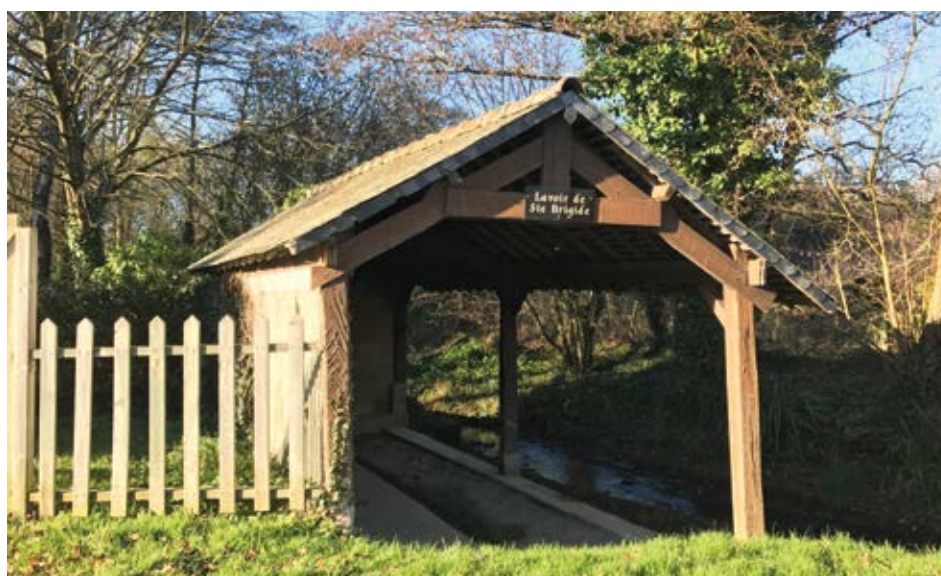
Le lavoir de Sainte-Brigide