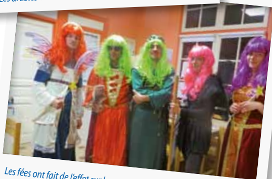
Les fées ont fait de l'effet sur les artistes en résidence au gîte de la Gare !