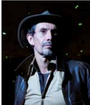
Nuit Blanche 2010 pour la Ville de Paris