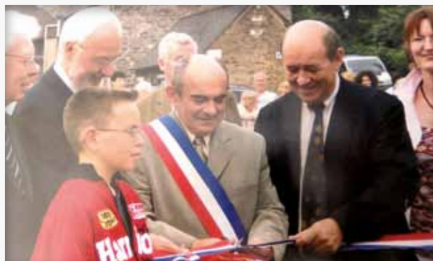
Jean-Yves Le Drian, en 2005