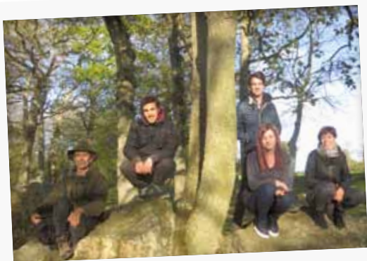
Les artistes ont découvert le site dès leur arrivée

Lucioles qui resteront en place jusqu'aux journées du patrimoine, en septembre, à découvrir tous les soirs en allant flâner aux mégalithes, et il ne faudra pas s'en priver, le site prend une autre dimension, encore plus... Féerique !!