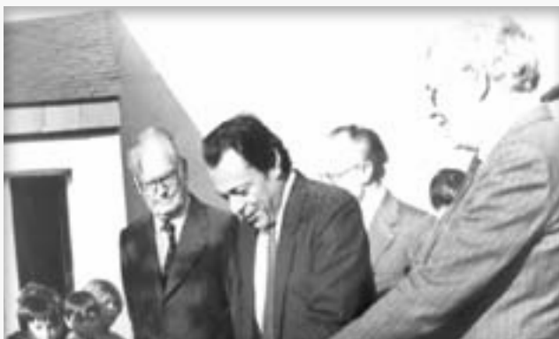
Michel Rocard, le 23 octobre 1982