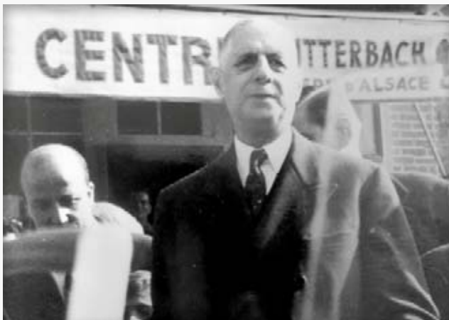
Charles de Gaulle, le 7 septembre 1960