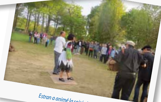
Estran a animé la soirée inaugurale