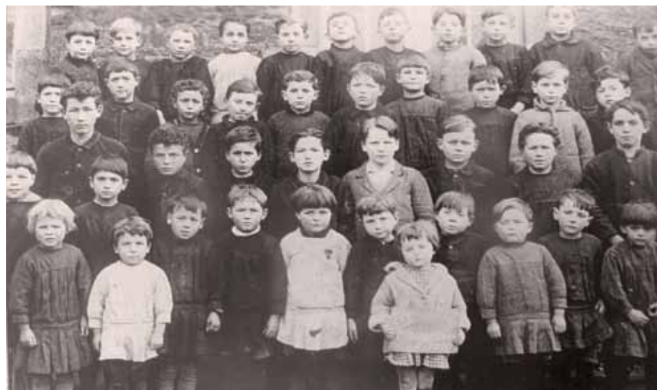
En 1930, école des garçons de Trigavou, l'instituteur absent sur la photo était M. Gouronnet.

Trigavou : le 13 août 1933 « Le conseil municipal décide de porter à 50 francs l'indemnité de couture attribuée à la maîtresse de couture ».