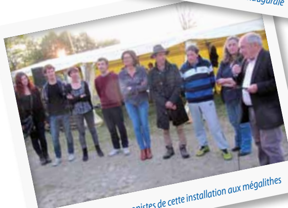
Les principaux protagonistes de cette installation aux mégalithes