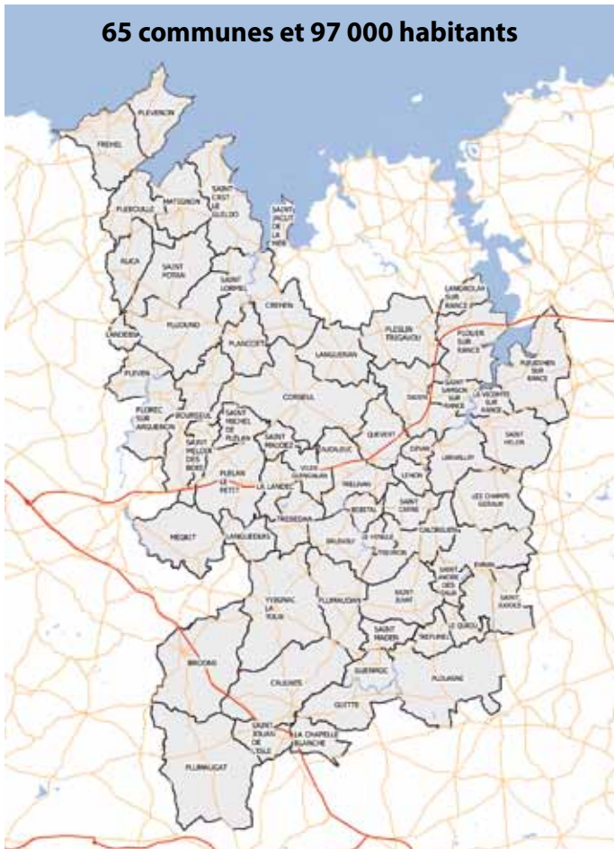
65 communes et 97 000 habitants

Notre territoire sera structuré autour de ses pôles : l'unité urbaine de Dinan, Plancoët-Plélan Le Petit, Pleslin Trigavou-Plouër, Pleudihen, Maignon-Saint Cast, Evran et Broons-Caulnes. Ces pôles concentrent une part importante de la population et des emplois du territoire. Mais on peut être rassuré par une volonté unanime de territorialisation de l'action communautaire garantissant et maintenant la proximité avec les habitants (on peut citer en exemples notre école de musique, notre Centre de Loisirs Sans Hébergement, qui devraient continuer à être gérés localement !)