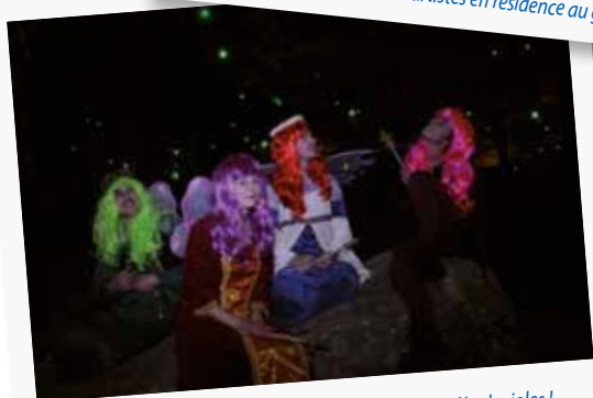
Effectivement de quoi être surpris la nuit avec les fées lucioles !