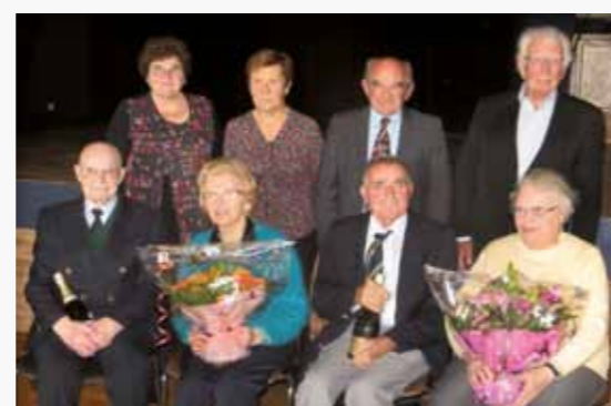
Le repas des Aînés