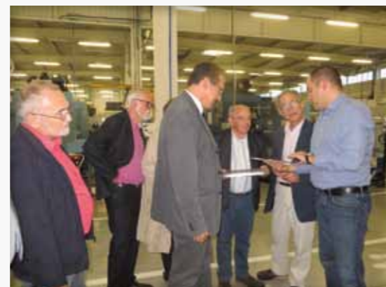
Chez Armor Méca