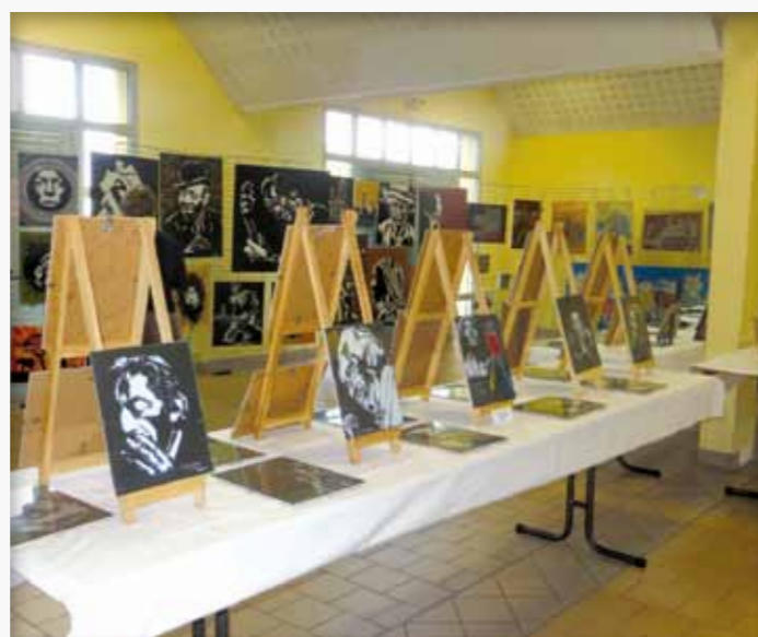
L'exposition de l'association Kalypika

Petite innovation cette année, puisque la fête de la musique était couplée avec une exposition de l'association Kalypika, un collectif d'artistes, plasticiens et musiciens. Autre 1 ère appréciée, la venue de la fanfare de Châteauneuf d'Ille-et-Vilaine. Malgré la qualité des groupes présents, un bémol : le public n'était pas présent en nombre, certainement attiré par d'autres fêtes de la musique « semi-pro » des alentours, au détriment de celle initiée dans l'esprit premier de cette manifestation : permettre aux musiciens de montrer ce qu'ils savent faire, jouer en public et ce... bénévolement !