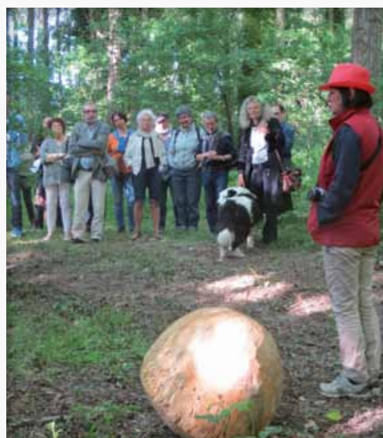
L'art est dans le bois