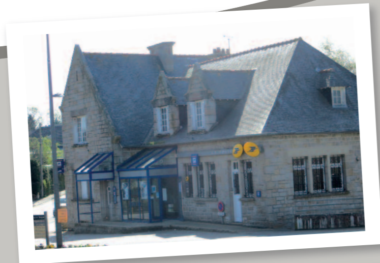
La poste se modernise pour un meilleur service au public Réouverture le 15 juillet.

Directeur de la Publication : M. J-P. Leroy, Maire Conception/réalisation : Eole Communication / Emmanuel David Impression : HPI Dépôt légal : juin 2015