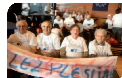
La résidence de l'Orme, vainqueur du tournoi de bowling 2014