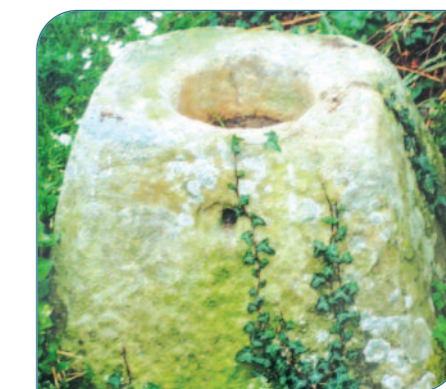
Les fonts baptismaux de la chapelle