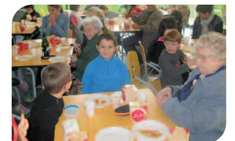
La venue des résidents à l'accueil de loisirs pour partager la galette des rois avec les enfants